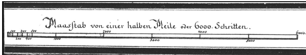
Fig. 6. Scara grafică a Planului Districtului Bucovina .

Revenind la scara de proporție, ea nu este redată numeric, ci doar sub formă grafică și directă (explicativă). Întregul segment mare reprezintă o jumătate de milă, respectiv 6.000 pași („ Maastab von einer halben Meile oder 6000 Schritten ”), el fiind împărțit în 6 segmente mai mici, a câte 1000 pași fiecare. La rândul ei, jumătatea din stânga a talonului este împărțită în 5 diviziuni, ceea ce indică și precizia scării: 100 pași ( Fig. 6. ).